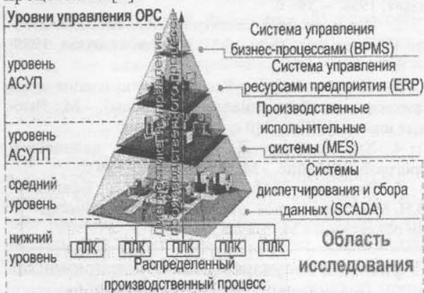
Рис. 1. Уровни управления предприятием

Введение. Современные автоматизированные системы управления (АСУ) технологическими процессами (ТП) предусматривают объединение всех подсистем управления отдельными участками производства и технологическими процессами в единую интегрированную систему, которая обеспечивает выполнение всех требуемых функций управления предприятием. В организации управления предприятием выделены уровни (рис. 1), которым соответствуют применяемые на них информационные системы (SCADA, MES, ERP, BPMS). Ключевыми функциями в работе этих информационных систем являются диагностика и управление производственными процессами. Удобным инструментом в реализации вертикали этих функций является OPC технология, предоставляющая единый интерфейс для управления объектами автоматизации и технологическими процессами [0].