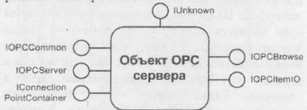
Рис. 3. Стандартные интерфейсы OPC сервера

Базовая реализация интерфейса IDAIDevice представлена в классе CDAIComponentBase (рис. 4), находящемся на стороне OPC сервера. При разработке компонентов интеграции для конкретного устройства электроавтоматики необходимо реализовывать производные от CDAIComponentBase класс. В этом классе переопределяются требуемые методы в соответствии со специфическими особенностями устройства электроавтоматики.