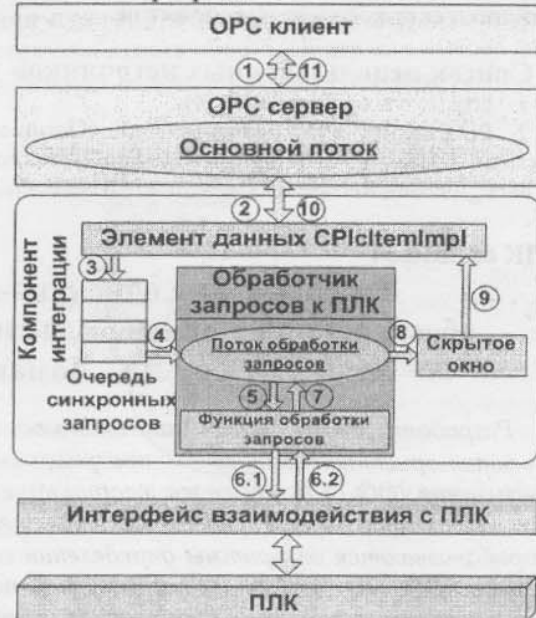
Рис. 6. Обработка синхронного запроса OPC клиента

запросов (вызов 3) и обрабатывается в отдельном потоке функцией обработки запросов (вызов 4). Дополнительный поток обработки запросов необходим для того, чтобы организовать одновременный доступ к синхронным сервисам OPC сервера для его клиентов.