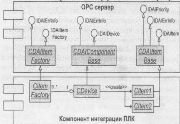
Рис. 4. Интерфейсы интеграции компонентов сервера

Для того, чтобы скрыть подробности создания конкретного экземпляра, производного от базового класса CDAIComponentBase, используется интерфейс фабрики устройства IDAIDeviceFactory. Производный объект создается с помощью метода CreateDevice интерфейса фабрики устройства. Следует отметить, что каждое устройство имеет свой производный класс от CDAIComponentBase, а следовательно и свою особенную реализацию интерфейса IDAIDevice. OPC сервер имеет возможность создавать единообразно различные устройства IDAIDevice на логическом уровне.